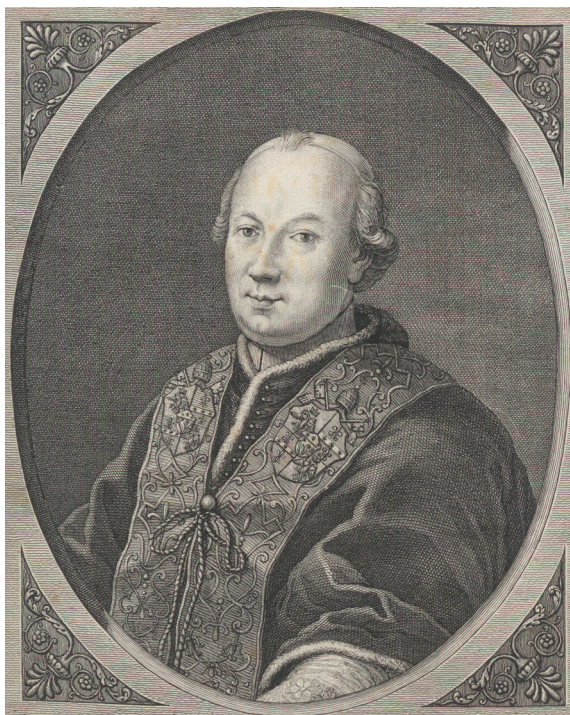
Ritratto di papa Pio VI, in STEFANO BORGIA, Vaticana confessio beati Petri principis apostolorum chronologicis tam veterum quam recentiorum scriptorum testimoniis inlustrata opera et studio Stephani Borgiae ... , Romae, ex Typographia Sac. congr. de prop. Fide, 1776 (PIO 6. 3374).

Tra le committenze più significative vi furono la riedificazione della collegiata di Sant'Andrea e dell'adiacente Seminario, nonché la ristrutturazione della Rocca abbaziale posta a dominio dell'abitato che, da maniero difensivo, venne trasformata in una splendida residenza degna di accogliere il pontefice e la sua corte. Alle iniziative tese a riqualificare le emergenze architettoniche e l'urbanistica di Subiaco, si aggiunsero interventi volti a migliorare le condizioni di vita e di sussistenza della popolazione. Il pontefice volle anche elevare Subiaco al rango di «città» e permise che venisse inserito il suo stemma gentilizio in quello municipale quale «segno invariabile del di lui amorevolissimo attaccamento».