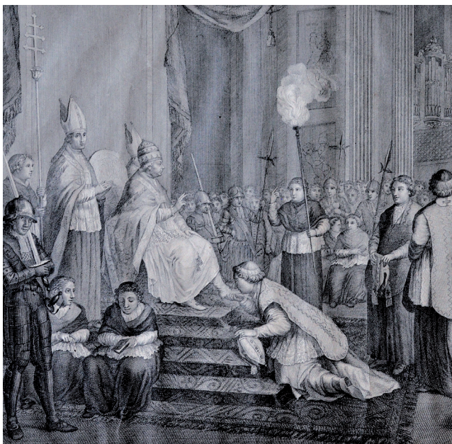
GIACOMO BEYS (inventore e disegnatore), ANTONIO POGGIOLI (incisore) Incoronazione del sommo pontefice Pio Sesto. Seguita in Roma il di 22 febr. jo 1775 Roma 1801, bulino, tot. 43 x 54,4; impronta della matrice: 37,3 x 48,3 (S-0261; 00769).

Mauro Meacci, OSB Abate ordinario di Subiaco