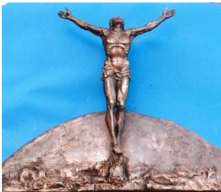
Via Crucis, Crocifissione-Resurrezione, Bronzo – Chiesa di Sant'Agata alla Caldura - Cefalù (PA)