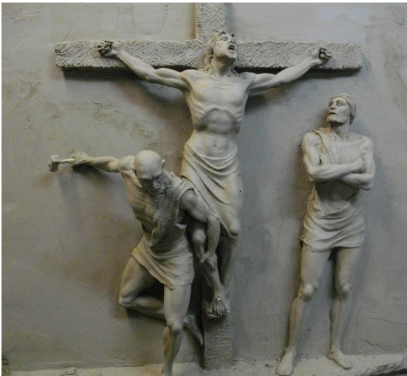
11° stazione della via crucis - Cristo inchiodato alla croce