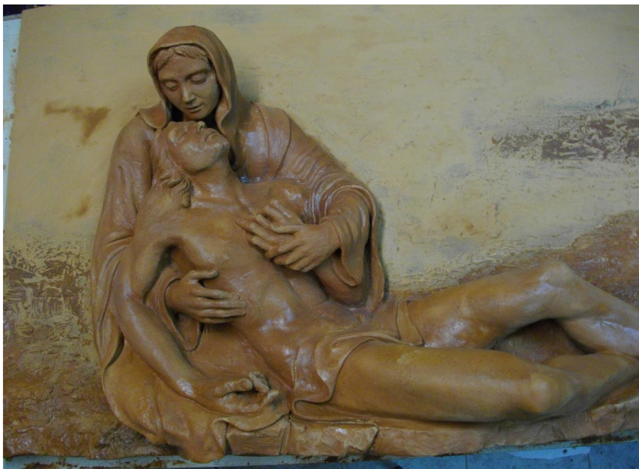
Cristo in pietà –terracotta invetriata- Chiesa Dell'Addolorata - Contrada Ferla, Cefalù (PA)