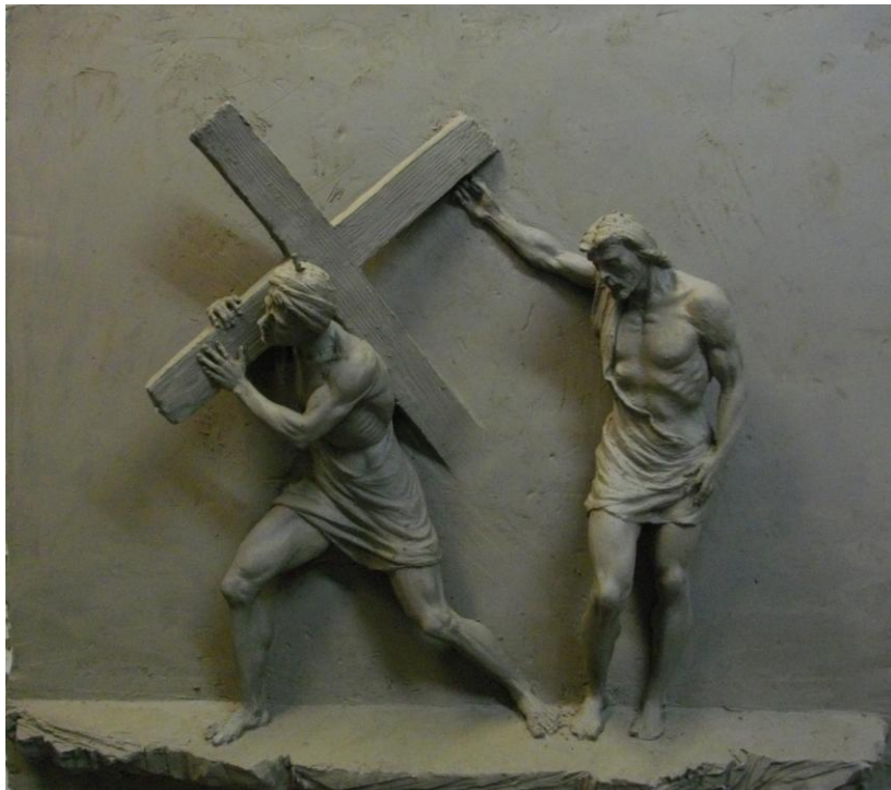
5° stazione della via crucis - Cristo aiutato da Cireneo