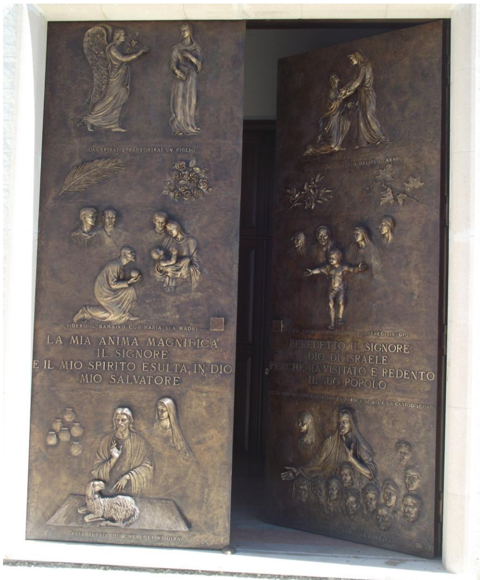
Portone d'ingresso (bronzo)

Chiesa dell'Immacolata, Villaggio Chianchitelli - Alia (PA)