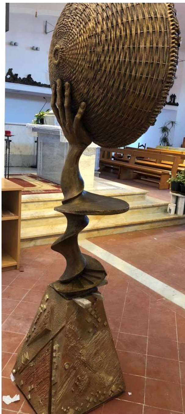
Custodia eucaristica in bronzo e terracotta - Chiesa Sant'Agata V. M., Cefalù (PA).