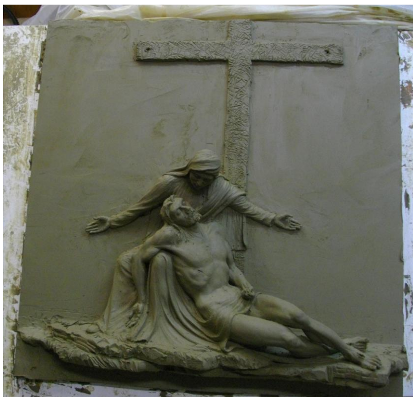
13° stazione della via crucis - Cristo