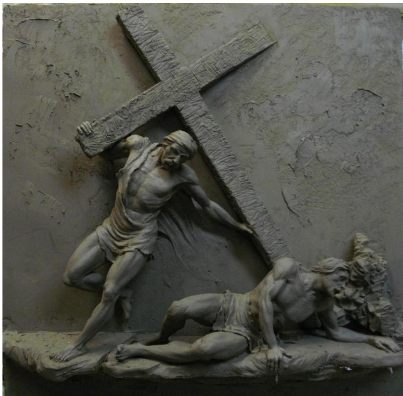
3° stazione della via crucis – prima caduta