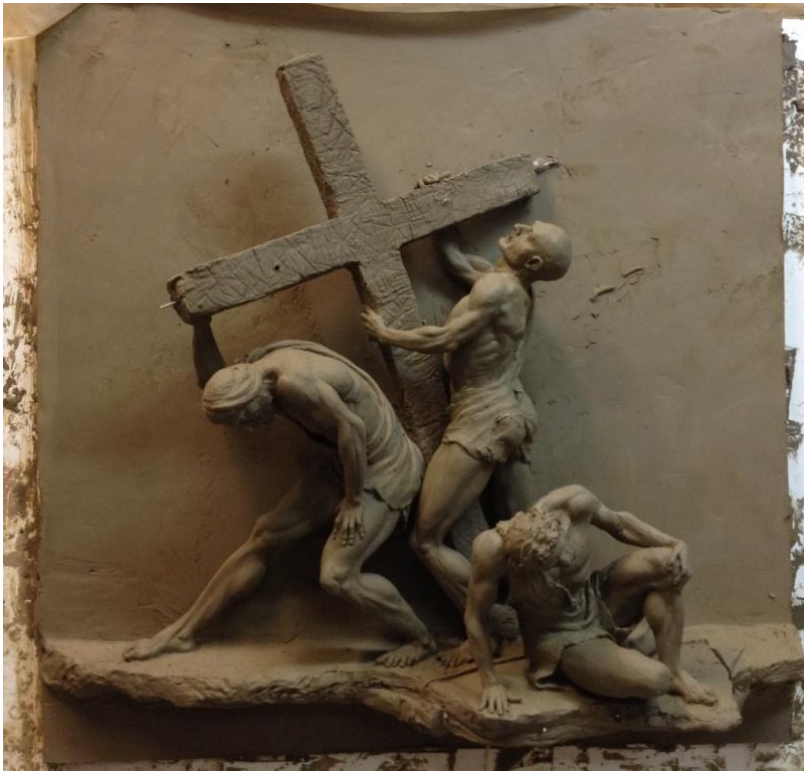
9° stazione della via crucis - Cristo cade per la terza volta