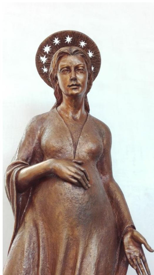
Donna vestita di sole (Maria Immacolata), bronzo, Chiesa dello Spirito Santo – Cefalù (PA)