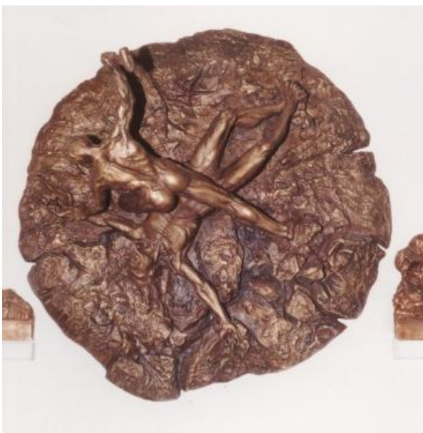
Via Crucis, Cristo inchiodato sul mondo (bronzo)

Chiesa di Sant'Agata alla Caldura - Cefalù (PA)